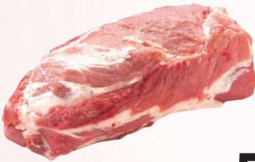
Frischer Schweinenacken (Kamm) ohne Knochen, im Strang, ca. 2,8 kg 1 kg