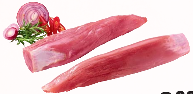
Frisches Schweinefilet ohne Kopf 1 kg