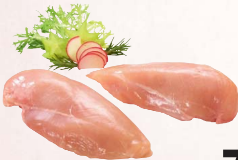
Frisches Hähnchenbrustfilet ohne Innenfilet 1 kg