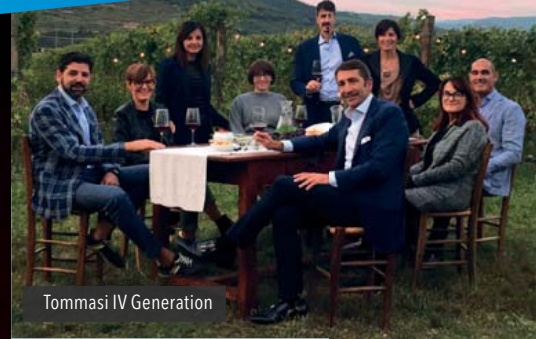
Tommasi IV Generation