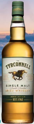
The Tyrconnell Single Malt Irish Whiskey 40% Vol., Zitrusnote, geröstete Nüsse 0,7-l-Flasche 11 = 28,56 19,99