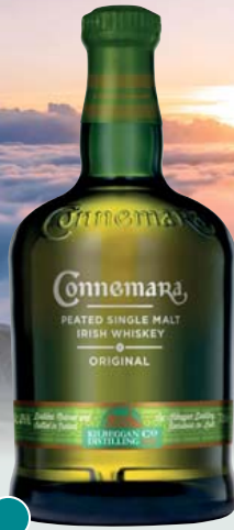
Connemara Peated Single Malt Irish Whiskey 40% Vol., Torfrauch, Heide- kraut, Honig, Eiche 0,7-l-Flasche 11 = 32,84 22,99