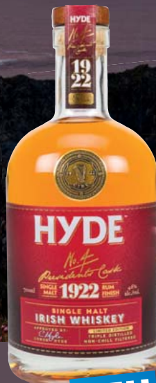
Hyde No. 4 Irish Single Malt Whiskey, Rum Finish 46% Vol., dunkler Honig, Dattel, Aprikose 0,7-l-Flasche 11 = 52,84 36,99