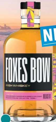
Foxes Bow Irish Whiskey 43% Vol., Vanille, rote Früchte, Gewürze 0,7-l-Flasche 11 = 35,70 24,99