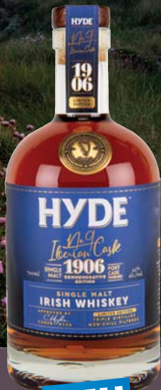
Hyde No. 9 Irish Single Malt Whiskey, Port Finish 43% Vol., getrocknete dunkle Früchte, Zimt, Trauben 0,7-l-Flasche 11 = 49,99 34,99