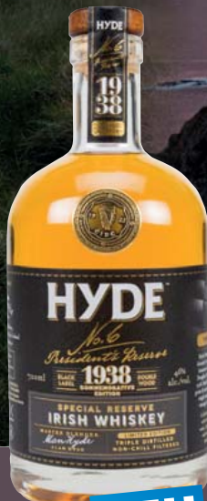
Hyde No. 6 Special Reserve Irish Whiskey, Sherry Finish 46% Vol., Vanille, Waldhonig, Litschi 0,7-l-Flasche 11 = 49,99 34,99