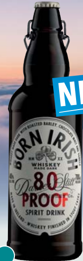
Born Irish 80 Proof 40% Vol., Schokolade, Gewürze, Gerstenotte 0,7-l-Flasche 11 = 38,56 26,99