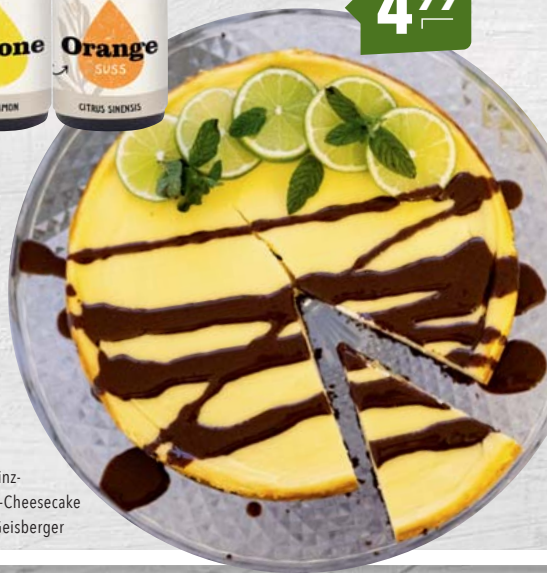
Pfefferminz- Limetten-Cheesecake ©Maria Geisberger