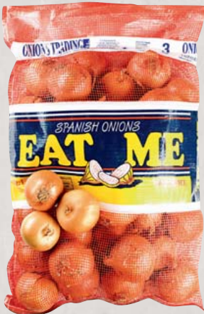
Gemüsezwiebeln aus Spanien KI.II 10-kg-Sack