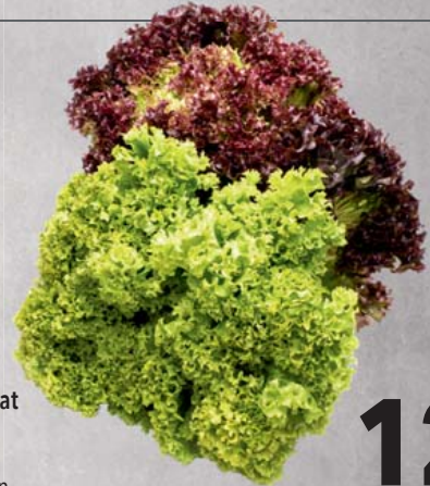
Lollo Rosso oder Lollo Bionda Salat aus Spanien KI.I je 10-Stück-Karton