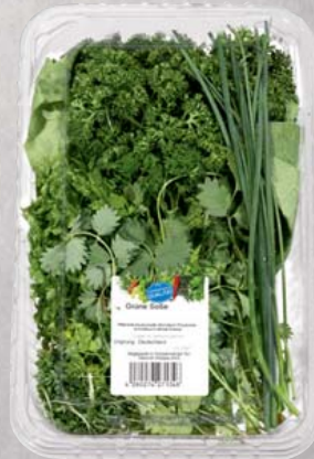
GV Kräuterschale aus Deutschland diverse Sorten, küchenfertig, z.B. Basilikum, Estragon, Kerbel, Koriander, Lorbeer, Majoran, Minze, Petersilie glatt oder kraus, Rosmarin, Salbei, Schnittlauch, Thymian je 150-g-Schale