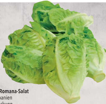
Mini-Romana-Salat aus Spanien 3er-Packung