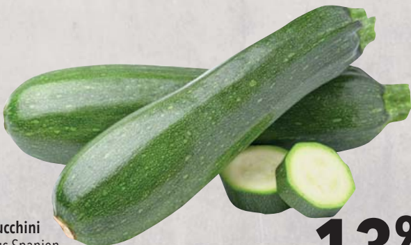
Zucchini aus Spanien KI.I 5-kg-Karton