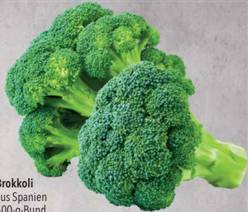
Brokkoli aus Spanien 500-g-Bund