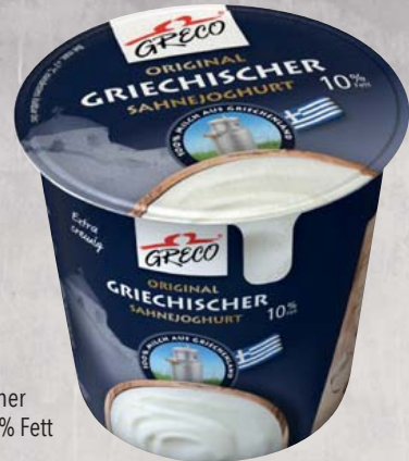
Greco Sahnejoghurt original griechischer Sahnejoghurt, 10% Fett 1-kg-Becher