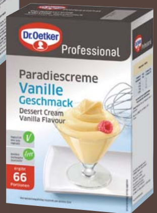
Dr. Oetker Paradiescreme verschiedene Sorten je 1-kg-Packung