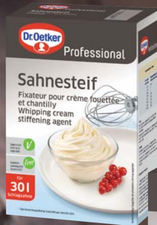
Dr. Oetker Sahnesteif 1-kg-Packung