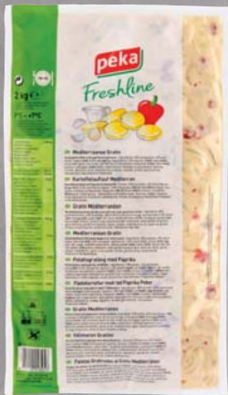
Peka Kartoffelaufauf mediterran 2-kg-Beutel