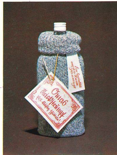
28/6 Oma's Strickstrumpf, 32%iger Likör, nicht nur für Omas!