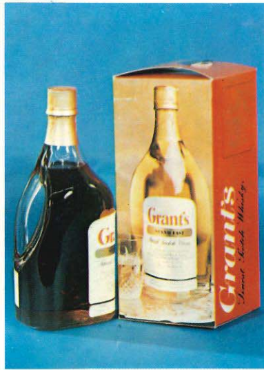
28/2 Grant's Whisky „Big Bottle“, 1,785 Ltr.