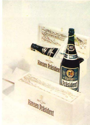
28/3 Präsident Magnum Flasche - 1,5 Ltr. - in Holzkiste