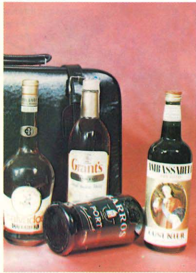
28/1 Euromark: Europa-Flugasche, 1/1 Grant Whisky, 1/1 Calvados-Cusenier, 1/1 Aperitif Ambassadeur, 1/1 Barros Port