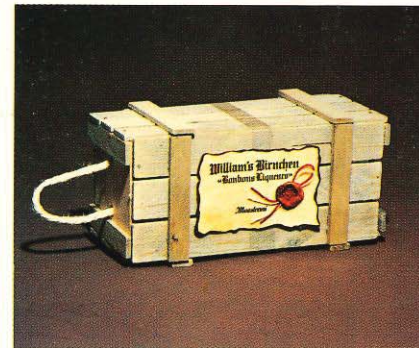
28/7 Holzkistchen „Maestranie-Williamsbirnen“

★ Die aufgezeigten Geschenkideen sind nur ein Auszug aus einem noch umfangreicheren Sortiment. Überzeugen Sie sich durch einen Besuch.